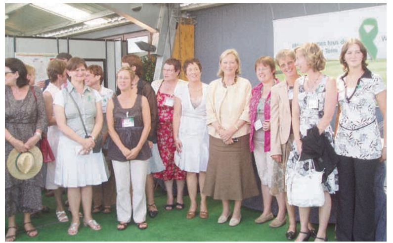
2008 - Rencontre avec la Reine Paola

neur tous les types d'agriculture en organisant leur premier concours photo en 2009 sur le thème : « Ma femme, ma partenaire », concours inauguré dans nos locaux par la Reine Paola. Pari gagnant car depuis, chaque année, ce concours met en valeur notre beau métier et ses multiples facettes et souvent en rapport avec la thématique de la Foire.