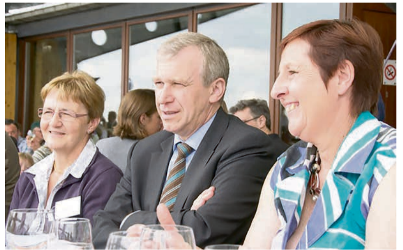
2010 - Rencontre avec le Premier ministre Yves Letermé