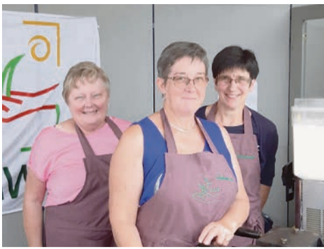
Des équipes conviviales