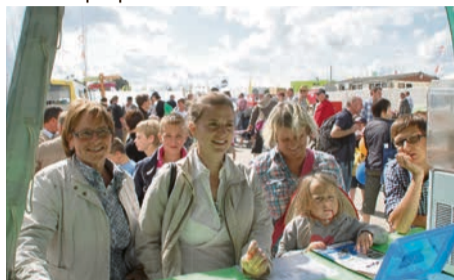
2012 - Succès constant malgré le déménagement du stand