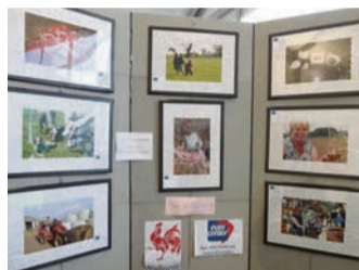
2013 - Concours photo