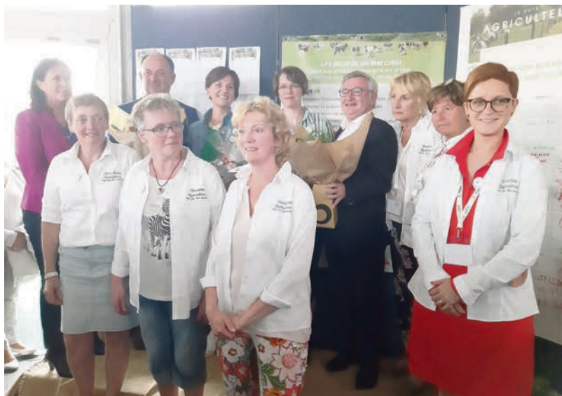
2019 - Bureau UAW