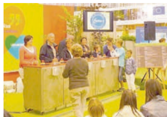
2010 - Qui veut gagner sa croûte - podium principal

Par Myriam Lambillon – coordinatrice UAW