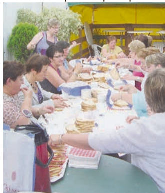
Merci aux dames de Luxembourg