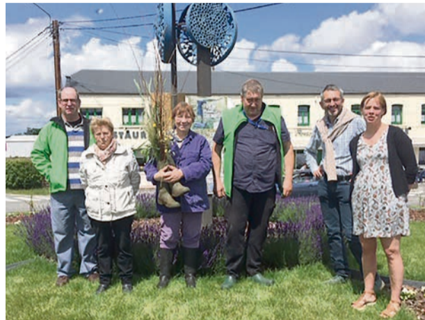
UAW Philippeville Florennes