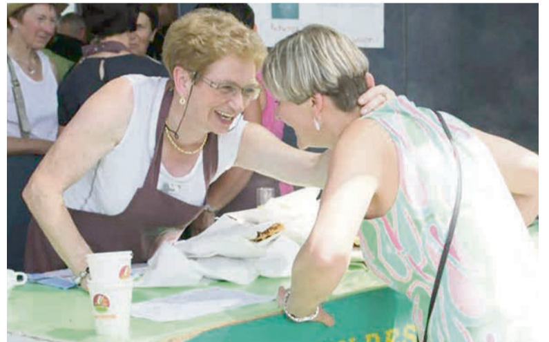
La Ministre de l'agriculture Sabine Laruelle toujours présente