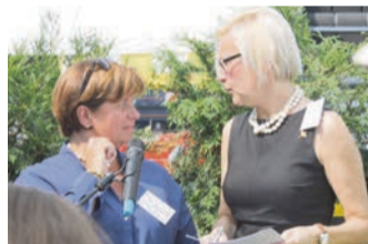
2014 - Complicité entre deux présidentes