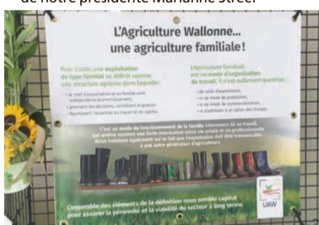
L'agriculture familiale présentée par l'UAW

Ne dit-on pas que chaque Foire est unique et apporte son lot de souvenirs ? Cette année, nous ne serons pas prêtes à l'oublier, La Grande Dame ne sera pas parmi nous ! Aussi, nous allons prendre le temps, pour une fois, de nous poser et de regarder d'où nous venons afin de pouvoir apprécier les avancées de la place des agricultrices au sein de cette grande Foire connue internationalement.