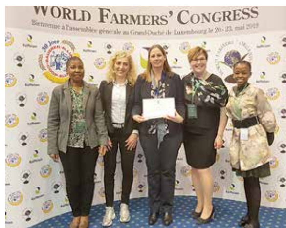
Lors du Congrès de l'Organisation mondiale des agriculteurs (2019)

Ma journée type dépend de la période de l'année. En hiver, je travaille à l'Université des sciences appliquées de Savonia en tant que maître de conférences. Là-bas, je travaille sur des projets de développement et j'enseigne. Ma journée de travail s'étend généralement de 8h00 à 16h00. Je voyage aussi souvent pour des réunions, principalement à Helsinki. À la maison, je fais la cuisine et m'occupe de la maison et de nos chiens, et je participe aux travaux agricoles si nécessaire. Les week-ends