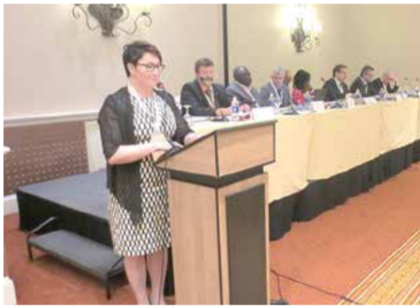
Discours lors du Congrès de l'Organisation mondiale des agriculteurs (2016)

Je travaille avec d'autres femmes dans toutes les fonctions que j'occupe. J'aimerais être un modèle, en particulier pour les jeunes femmes, en leur montrant qu'elles peuvent faire tout ce qu'elles veulent : ne laissez pas le genre vous freiner ! Je suis membre du comité des femmes de l'Organisation mondiale des agriculteurs depuis 2013 et je l'anime depuis 2015. Nous avons travaillé pour atteindre l'égalité de genre dans le domaine de l'agriculture. Notre objectif est de convaincre tous les acteurs du secteur agricole que l'égalité