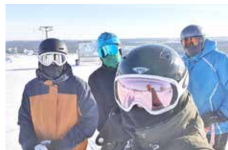
Ski en famille (Laponie)

Professionnellement, j'ai de nombreux rôles dans le domaine de l'agriculture comme vous l'avez sans doute déjà compris. Au-delà de ça, mes parents exploitaient une ferme laitière. D'ailleurs, de nombreuses personnes leur posaient des questions du type : « Comment gérez-vous la ferme, alors que vous n'avez que des filles et pas de